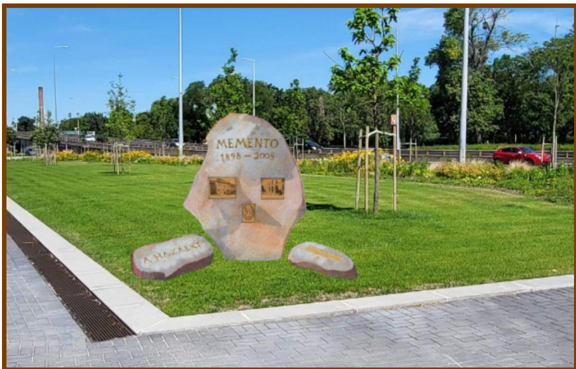
Az „Emlékhely” látványterve

A MEMENTÓ 1898 – 2008 cím utal arra, amiről az emlékmű szól! Az emlékezésről, a 110 éves múlt tiszteletéről.