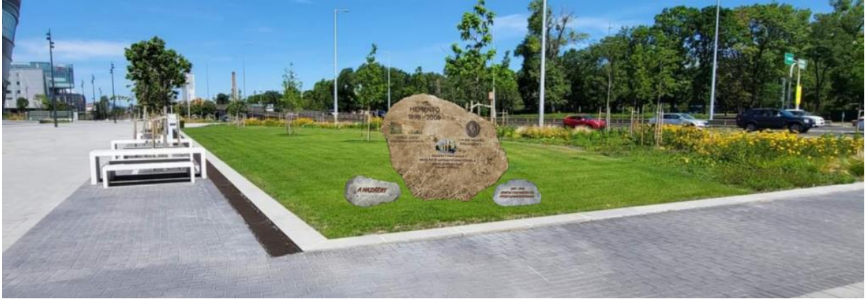
A magánerős emlékkő-kompozíció egyik vázlata