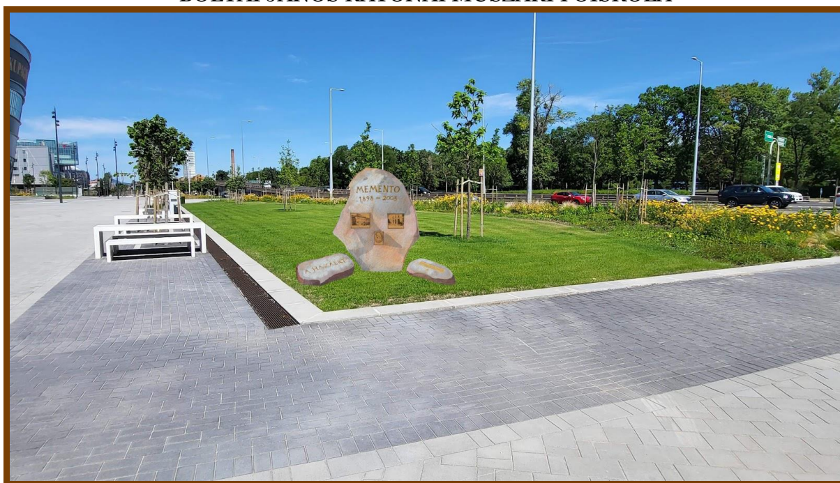
Az „Emlékhely” látványterve

Az Emlékkő-kompozíció három kőből áll, és ezek méretei az alábbiak.