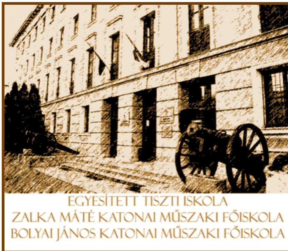
EGYESÍTETT TISZTI ISKOLA, ZALKA MÁTÉ KATONAI MŰSZAKI FŐISKOLA, BOLYAI JÁNOS KATONAI MŰSZAKI FŐISKOLA